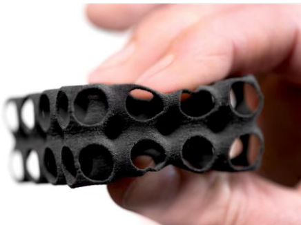
Weiches 3D-gedrucktes Elastomerbauteil aus PowderMonkeys® TPU 50