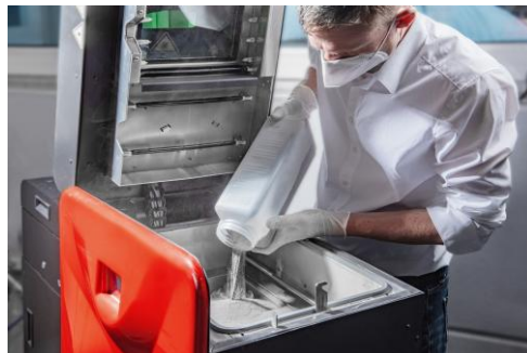
Befüllen eines SLS Desktop 3D-Druckanlage mit PowderMonkeys® Pulver

den Büroartikelbereich und die Maskenfertigung hergestellt.