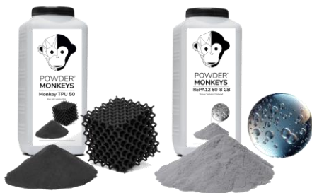
PowderMonkeys 3D-Druckpulver – Made in Germany

Für den industriellen 3D-Druck werden hauptsächlich pulverbasierte additive Fertigungsverfahren eingesetzt. Hierbei werden feine thermoplastische Kunststoffpulver in dünnen Schichten aufgetragen und dann z.B. mittels eines Lasers im selektiven Lasersintern, SLS oder mittels eines IR-Strahlers im High Speed Sintering, HSS aufgeschmolzen.